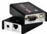
CE100 USB KVM信号延长器