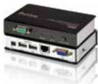
CE700A USB KVM信号延长器