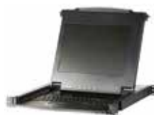
CL1000M 整合17"LCD显示器与 KVM控制端于单一抽拉式机体