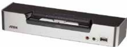
· CS1642A 前视图