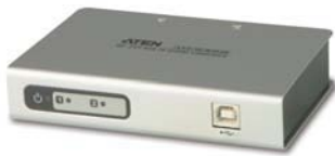
UC2322 2端口USB转串口RS-232界面集线器