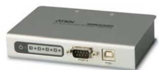
UC4854 4端口USB转串口RS-422/485界面集线器