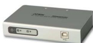
UC4852 2端口USB转串口RS-422/485界面集线器