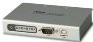
UC2324 4端口USB转串口RS-232界面集线器